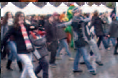
Flashmob au Marché de Noël | p12