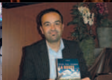
Salon du 1 er Roman | p16