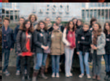
Collège Daudet à l'honneur | p10