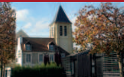
L'église Saint-Rémy | p9